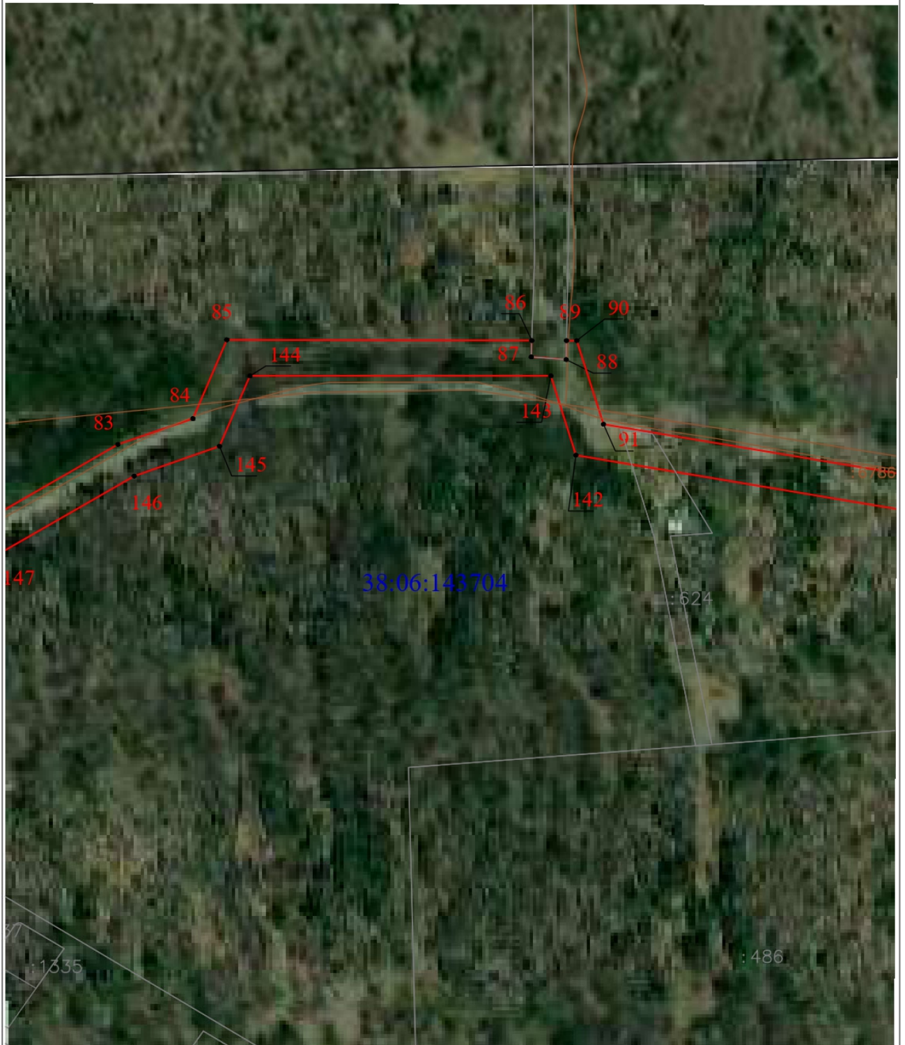
Схема границ публичного сервитута (выносной лист 4)