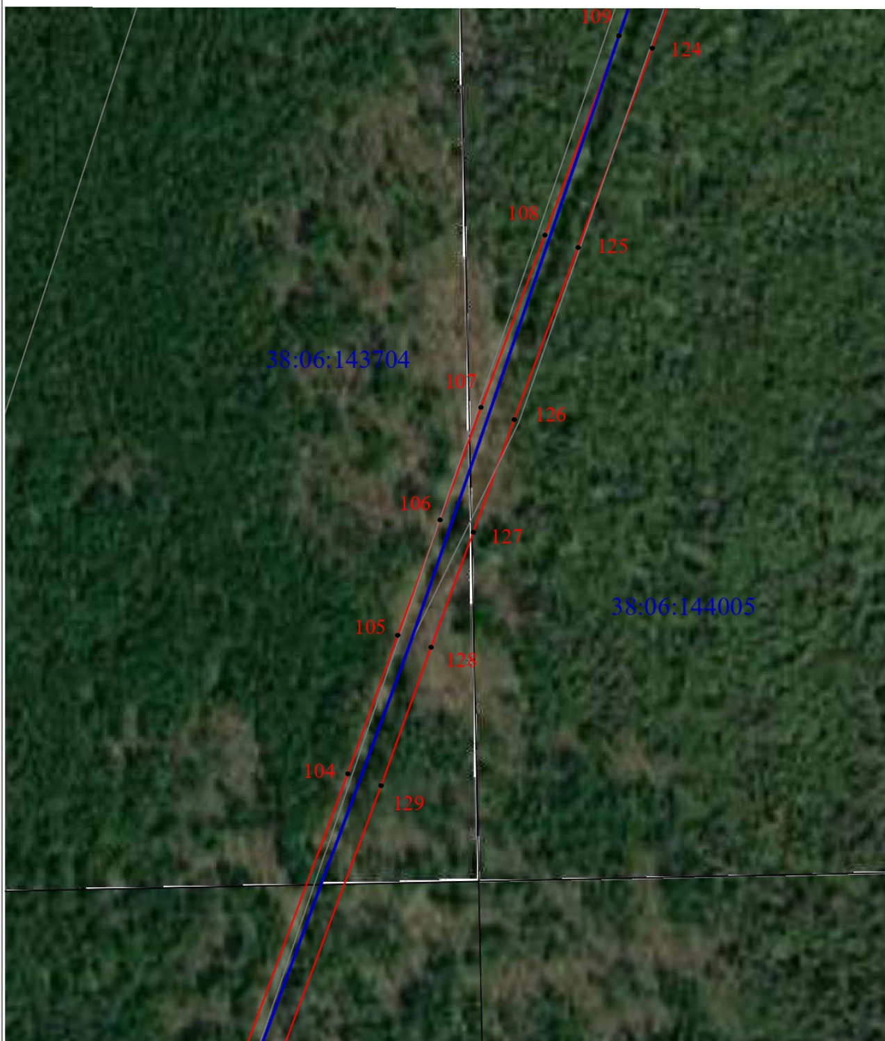
Схема границ публичного сервитута (выносной лист 7)