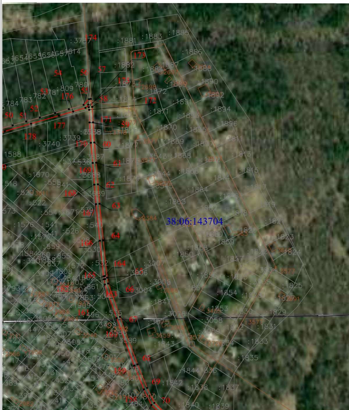
Схема границ публичного сервитута (выносной лист 2)