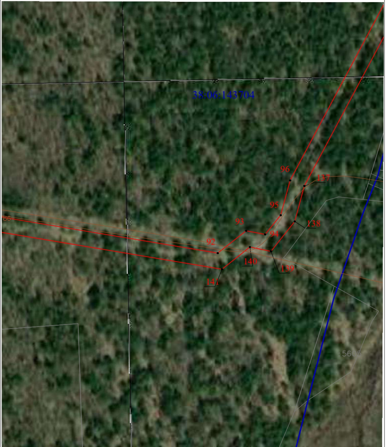
Схема границ публичного сервитута (выносной лист 5)