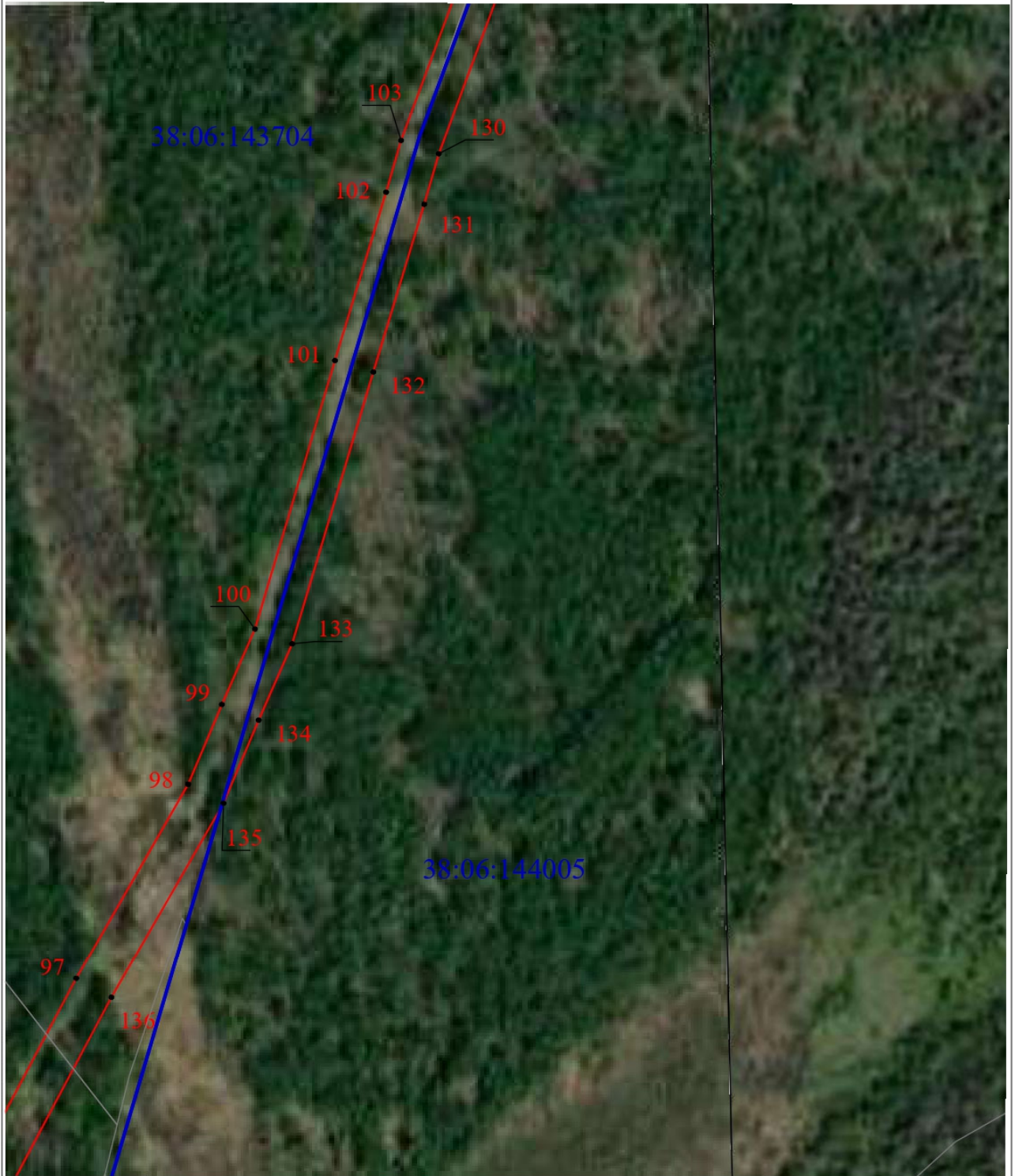
Схема границ публичного сервитута (выносной лист б)