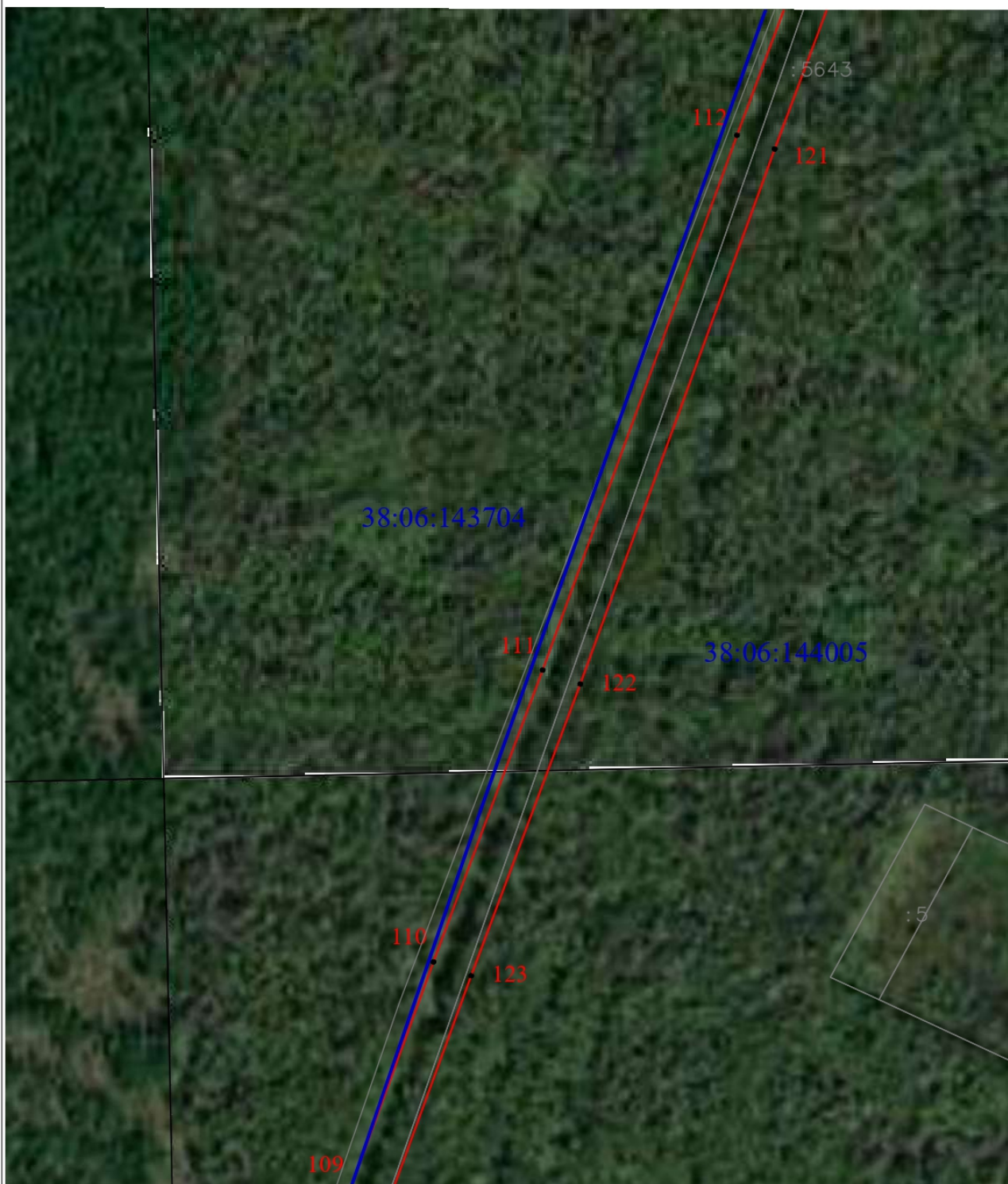
Схема границ публичного сервитута (выносной лист 8)