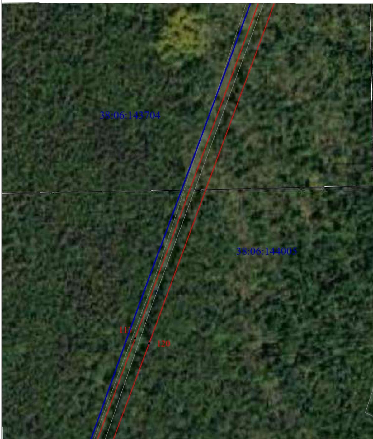
Схема границ публичного сервитута (выносной лист 9)