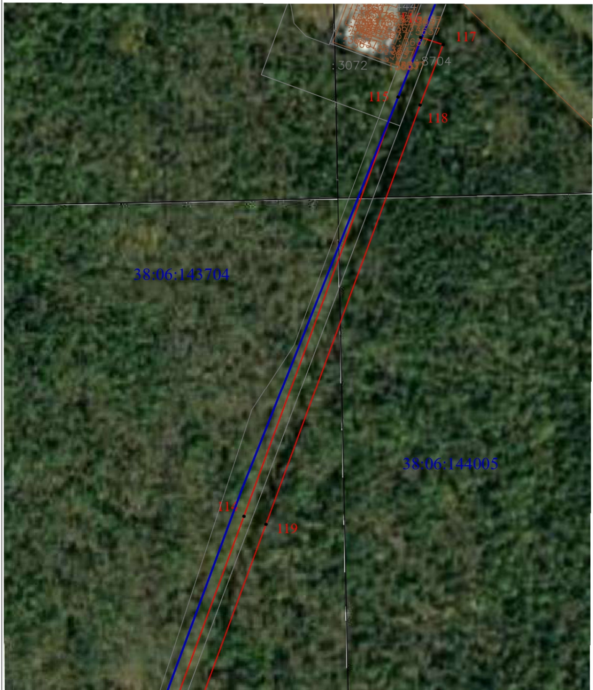
Схема границ публичного сервитута (выносной лист 10)