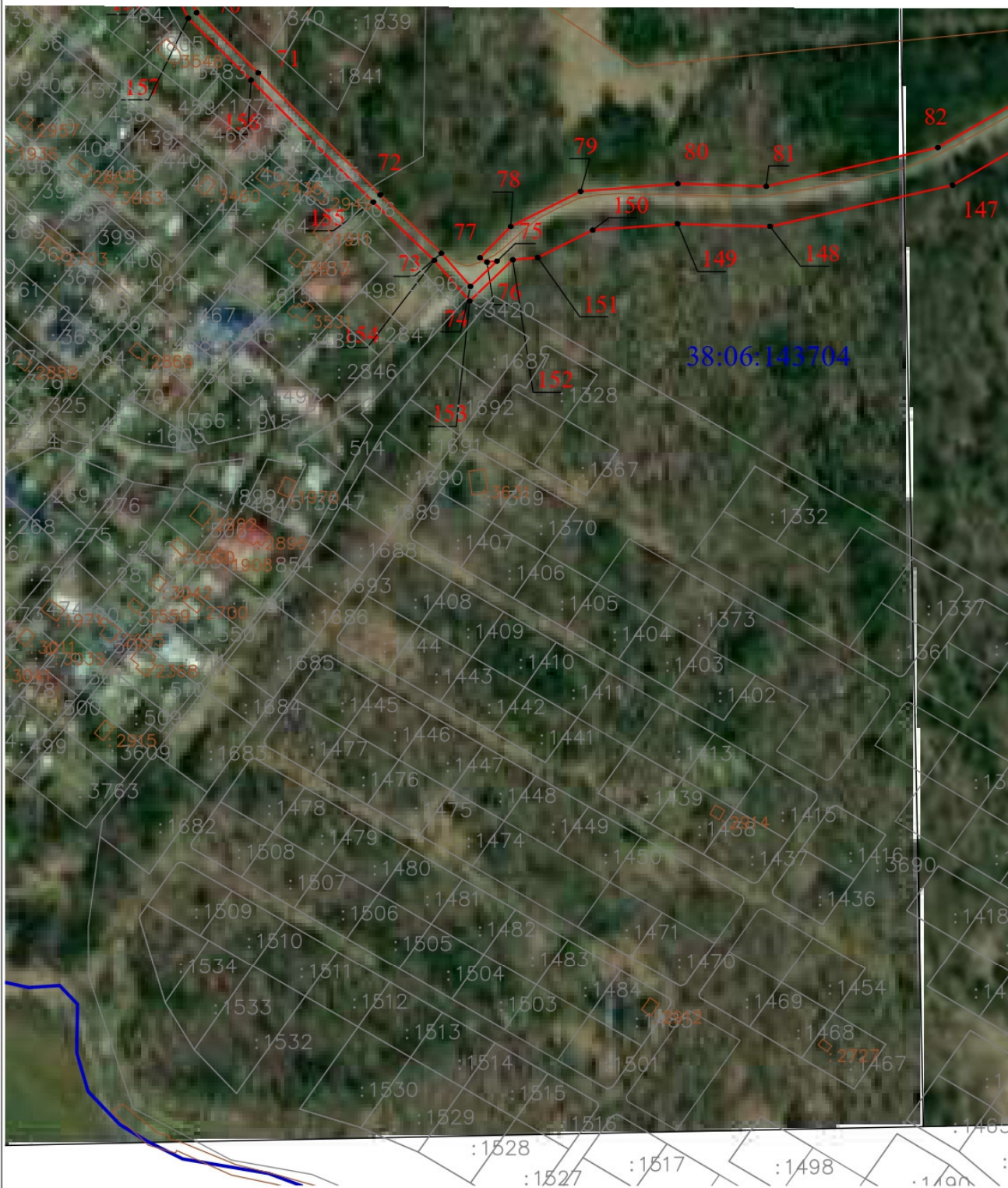
Схема границ публичного сервитута (выносной лист 3)