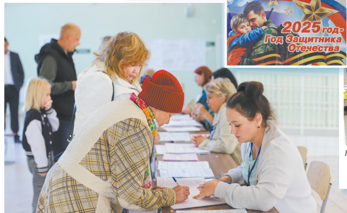
Члены избирательной комиссии в Держинске обладают большим опытом работы на выборах

По его словам, и мэру, и избранным депутатам в первую очередь нужно обратить внимание на состояние дорог, благоустройство и уборку территорий в Иркутском районе. Безусловно, все работы должны выполняться оперативно.