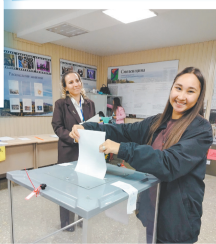
Впервые голосующие смоленские девушки и парни получили благодарности, аплодисменты и сладкие подарки