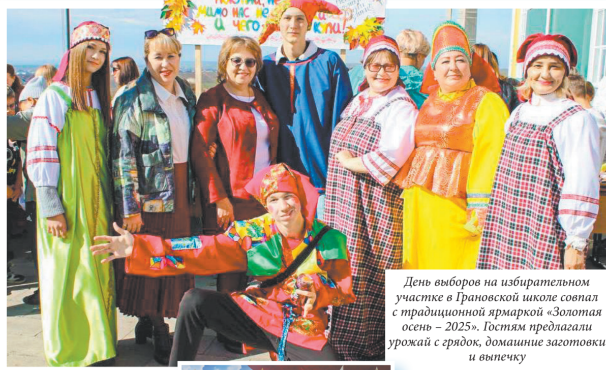
День выборов на избирательном участке в Грановской школе совпал с традиционной ярмаркой «Золотая осень – 2025». Гостиам предлагали урожай с грядки, домашние заготовки и выпечку