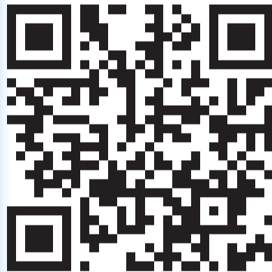
QR-код канала Леонида Фролова в сети «Телеграм»