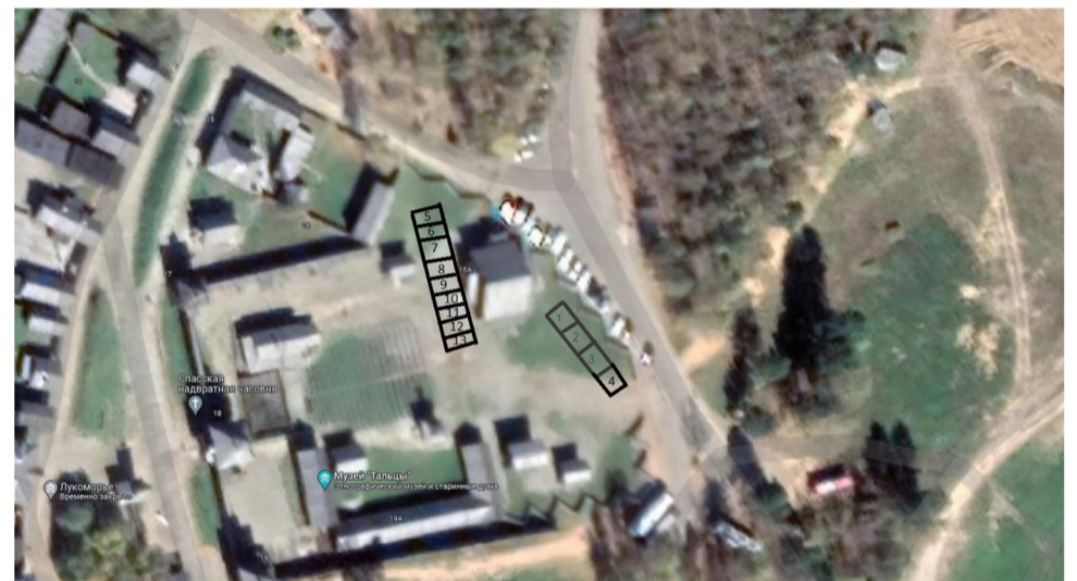
СХЕМА РАЗМЕЩЕНИЯ ТОРГОВЫХ МЕСТ НА ПРАЗДНИЧНОЙ ЯРМАРКЕ, «БАГАЧ»