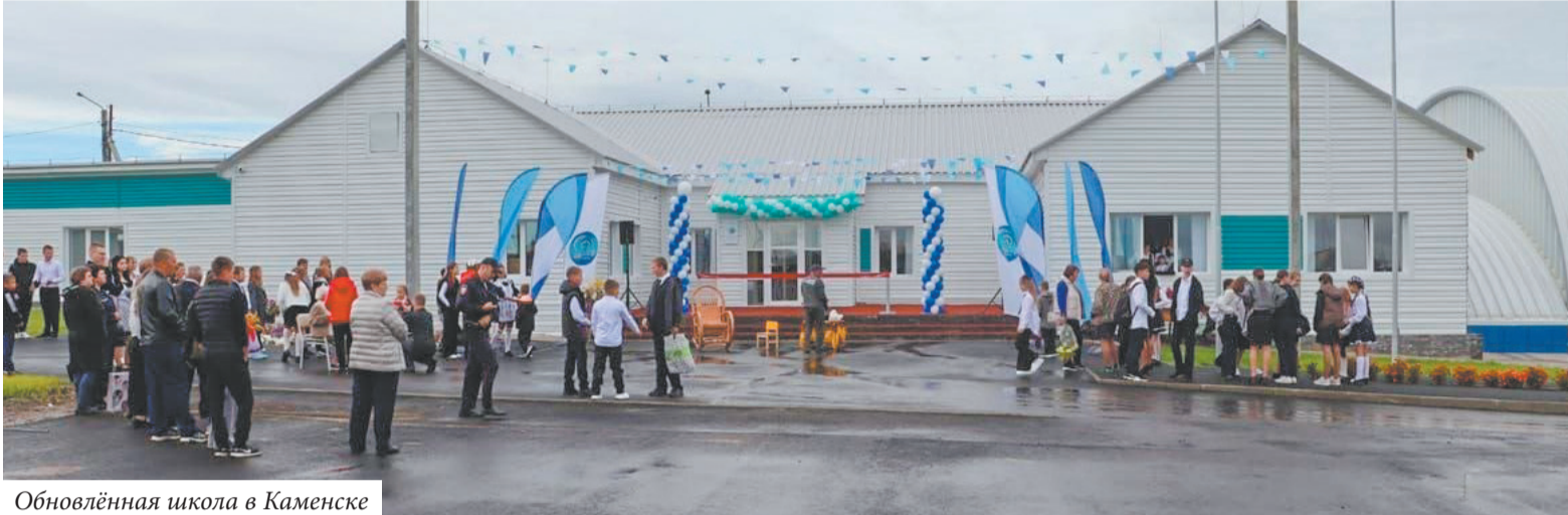
Обновлённая школа в Каменске

рассказали о важных социальных объектах в своих округах