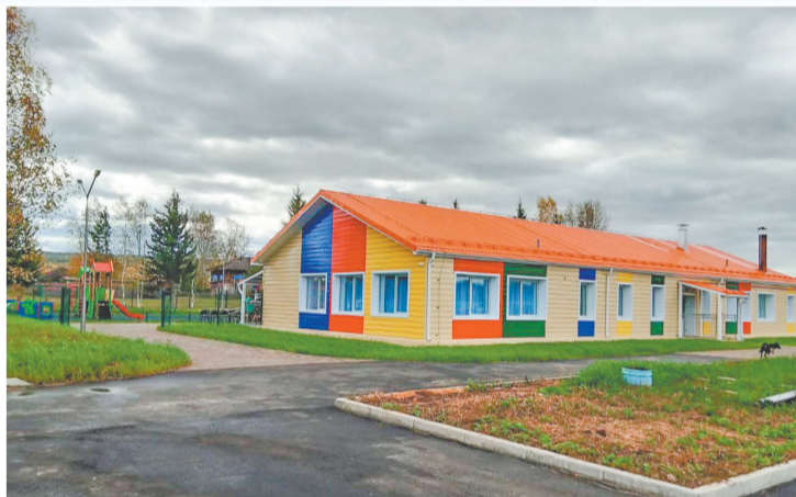
Поликлиника в Усть-Илимске в процессе ремонта