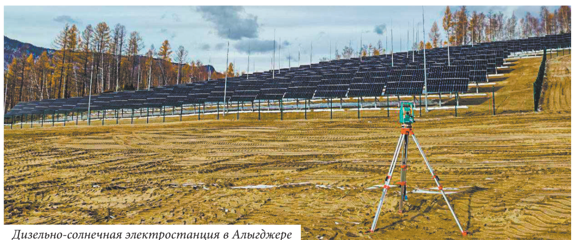
Дизельно-солнечная электростанция в Алыгджере