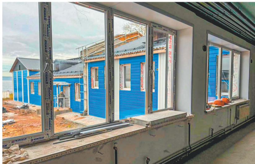
Школа № 6 в Братске готовится к открытию в этом году