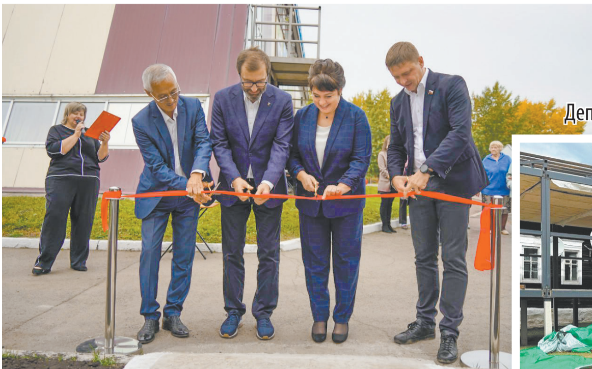
Торжественное открытие новой очереди в центре развития для особенных детей Свирска

Депутаты областного парламента много времени проводят на заседаниях: комитеты и комиссии, сессии и советы, собрания рабочих групп и прочее. Однако их работа не ограничивается кабинетами. Каждый из парламентариев держит на контроле целый ряд важных социальных объектов в своём округе. Следят за соблюдением сроков исполнения, проводят встречи с подрядчиками, обсуждают изменения с коллективами. Благодаря такому пристальному вниманию есть чем похвастаться. В городах и поселениях преобразуются школы, детские сады, библиотеки и клубы, поликлиники и амбулатории. Строятся и новые объекты, хотя такие проекты всегда очень масштабны и требуют немало времени. И всё же результаты есть, а поскольку сезон строительных и ремонтных работ почти завершён, уже можно рассказать о некоторых итогах.