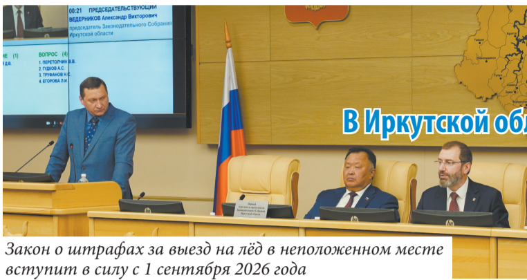
Закон о штрафах за выезд на лёд в неполюженном месте вступит в силу с 1 сентября 2026 года