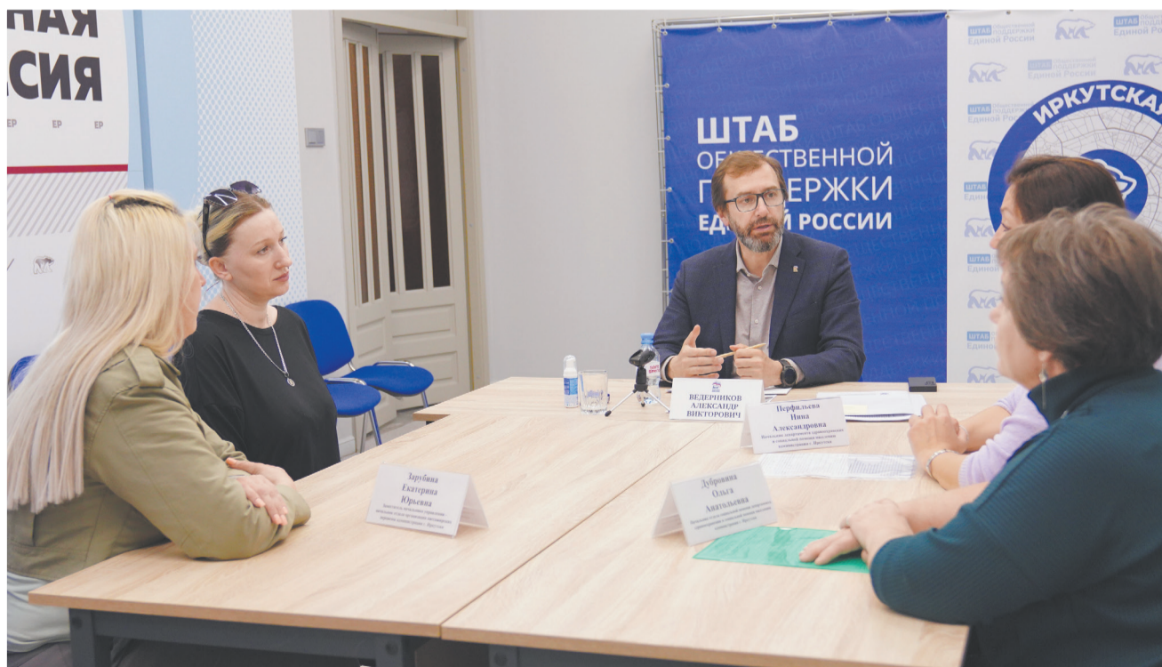
Во время личного приёма отвечать на вопросы помогают профильные специалисты