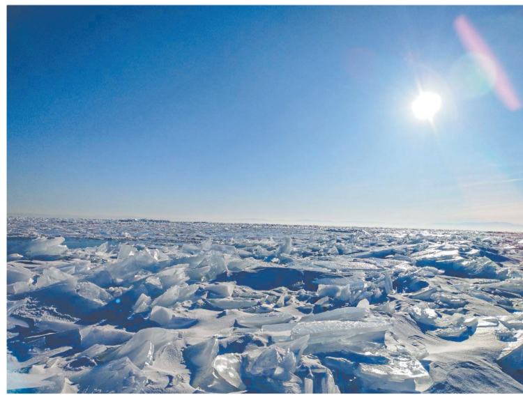
По материалам ИА «Телеинформ»

По данным спутникового мониторинга на большей части озера Байкал к 19 января установился ледяной покров. Как сообщает ФГБУ «Научно-исследовательский центр космической гидрометеорологии «Планета», этому способствовали сильные морозы, при которых температура воздуха опускалась до -40 °C и ниже. В районе посёлка Большое Голоустное Иркутского округа пока ещё наблюдается неполный ледостав. Кроме того, на юге озера, в районе посёлка Листвянка, сохраняется участок открытой воды, места наблюдаются забереги.