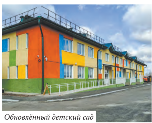
Обновлённый детский сад

Большую роль в селе играют культурные учреждения. В муниципалитете функционируют четыре клуба и две библиотеки. Работники культуры постоянно внедряют новые формы работы, не забывая о традициях поселений. Более десяти лет проводится окружной патриотический конкурс чтецов «Щит и Муза». Традиционными стали народный праздник «Иван Купала»