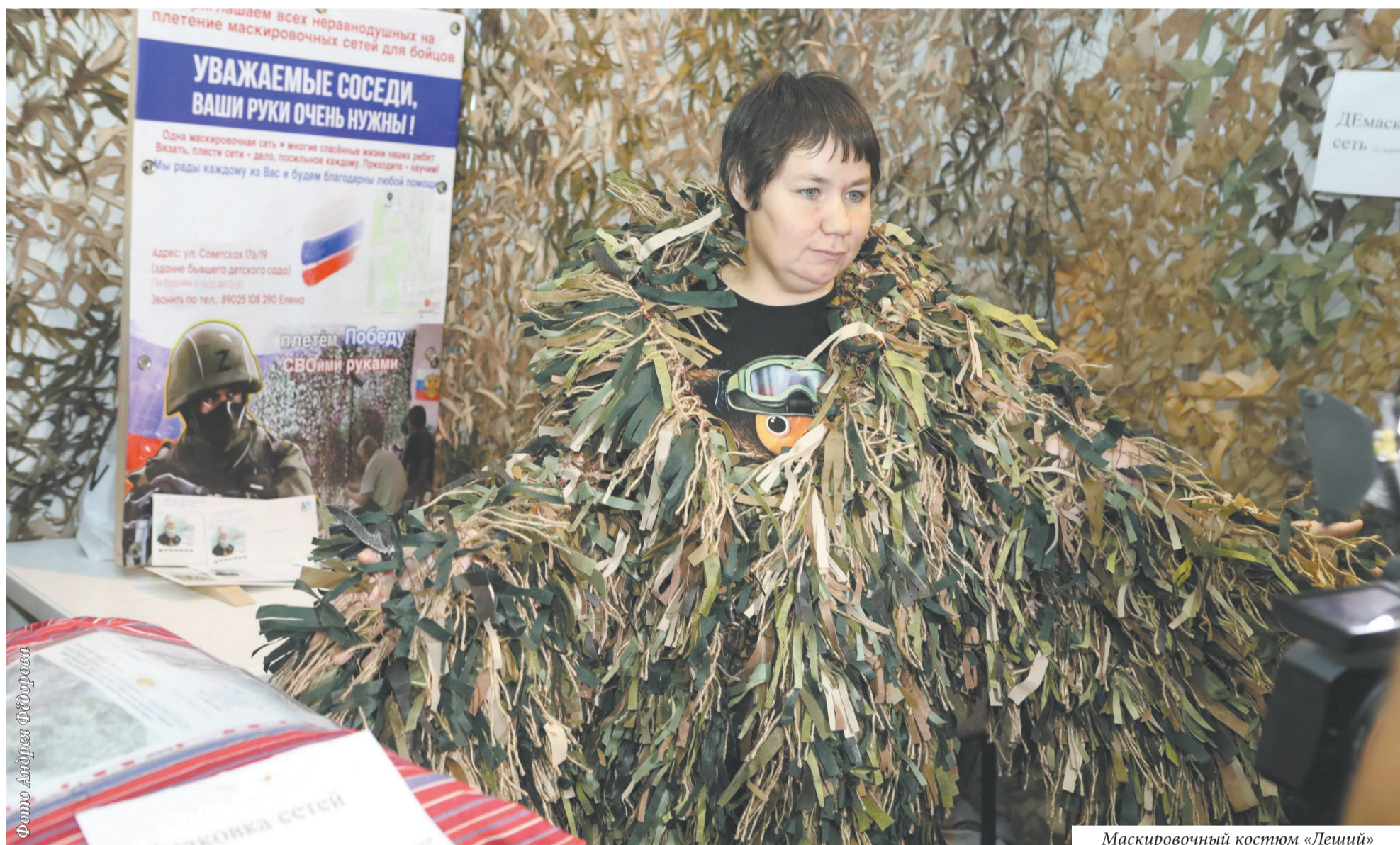
Маскировочный костюм «Леший»

Волонтеры Приангарья поделились своими идеями на первом региональном форуме «Своих не бросаем!»