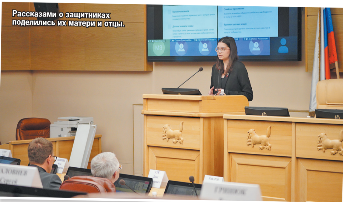
Рассказами о защитниках поделились их матери и отцы.

Семья, дети - эти понятия должны стать определяющими жизненного успеха. В качестве одной из мер закрепления этих ценностей предложено проводить в Иркутской области парад семей в День святых Петра и Февронии.