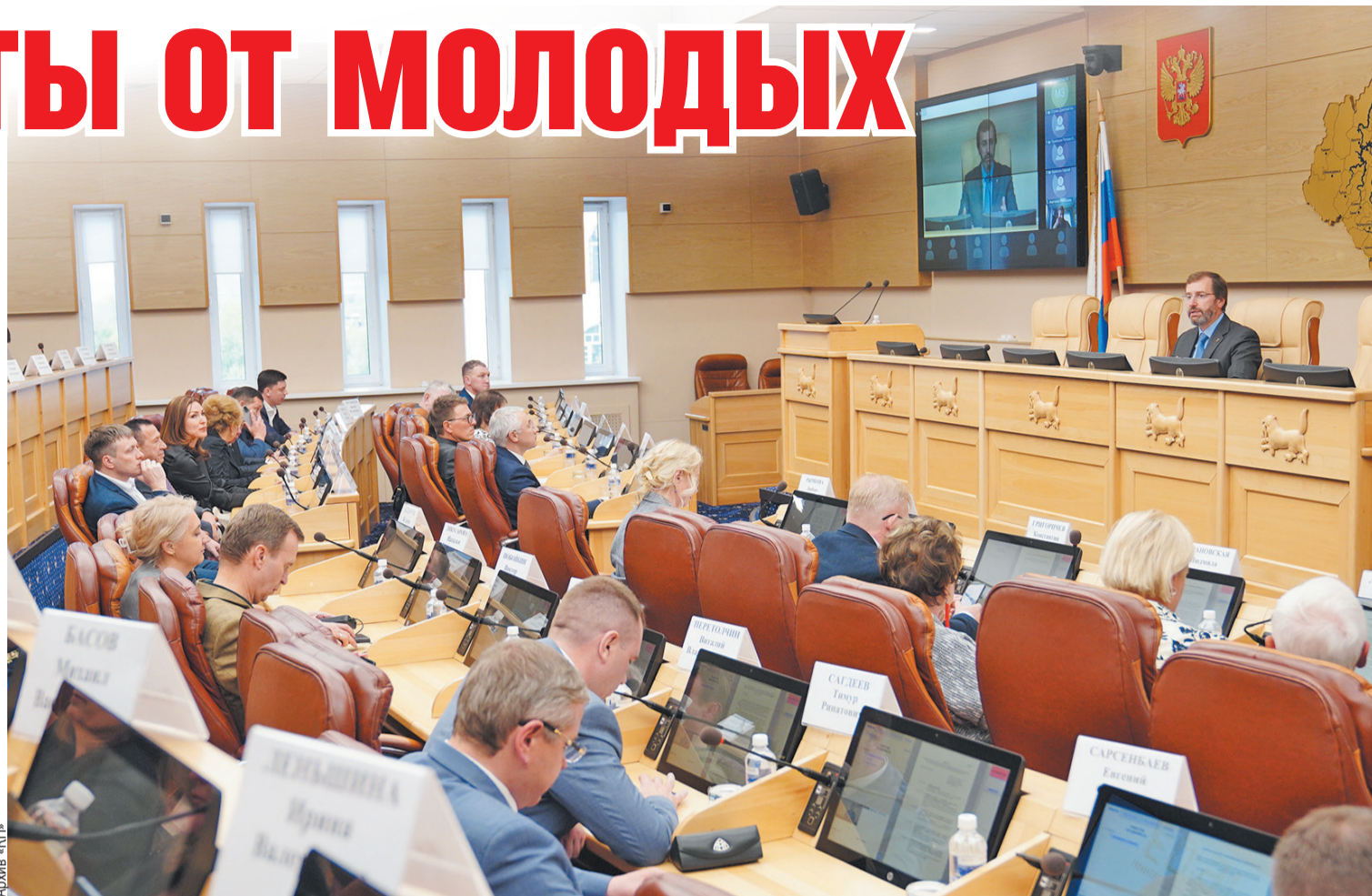
Рекомендации совета по демографии станут основой для будущих решений.