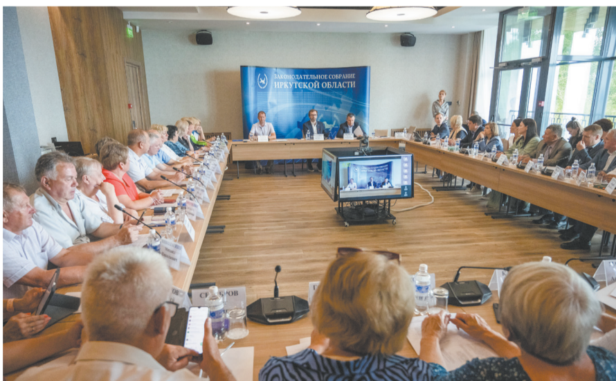
Участники совещания говорили о возможностях привлечения гостей в разные районы Приангарья