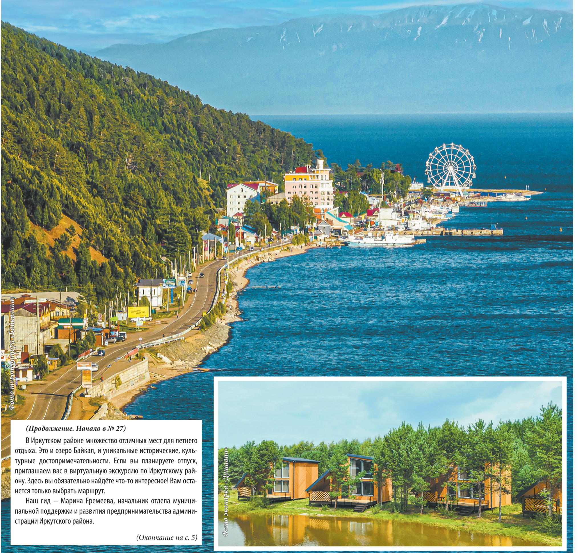
Фото туристического центра «Байкальск»

Гид по туристским развлечениям: от колеса обозрения до фестивалей