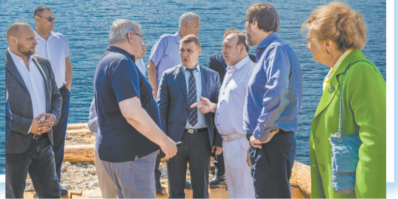
Депутаты посетили несколько туристических объектов в Листвянке

С каждым годом в Приангарье приезжает все больше туристов. Наши соотечественники и гости из других стран мечтают увидеть Байкал, а вместе с ним изучают и окрестности, посещая различные города Приангарья. Однако здесь намещё есть куда расти. Как помочь этой сфере развиваться, создавая новые, комфортные локации, рассчитанные на любой вкус и кошелёк, а вместе с этим и рабочие места для местных жителей, и возможности для запоминающегося отдыха? Об этом говорилось на выездном заседании совета регионально-парламентского взаимодействия с представительными органами муниципальных образований, которое прошло в Листвянке.