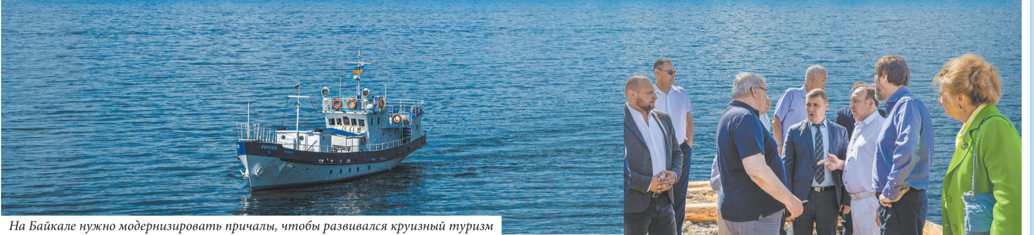
На Байкале нужно модернизировать причалы, чтобы развивался круизный туризм

Совет по взаимодействию с представительными органами муниципальных образований при Заксобрании обсудил развитие туризма