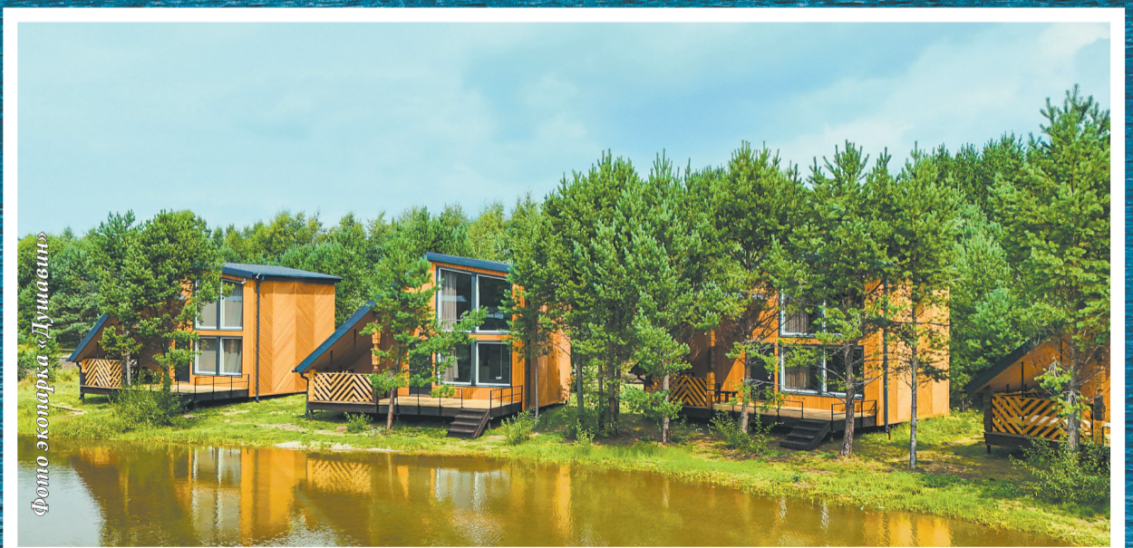
Фото экопарка «Душавин»