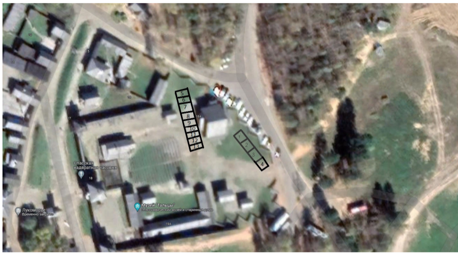
□ - Торговые места