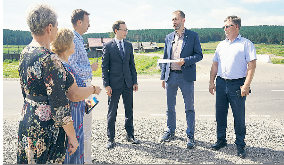
Качество ремонта дорог, выбор объектов, расстановка приоритетов - вот что в первую очередь интересует парламентариев в сфере дорожного строительства.

- Во-первых, помощь можно получить через депутатские поправки и инициативы. Своими поправками мы каждый год убеждаем правительство, и спасибо за поддержку губернатору Игорю Кобзеву, что на эти инициативы выделяют деньги. В частности, увеличивается финансирование таких программ, как «Есть решение» и «Народные инициативы».