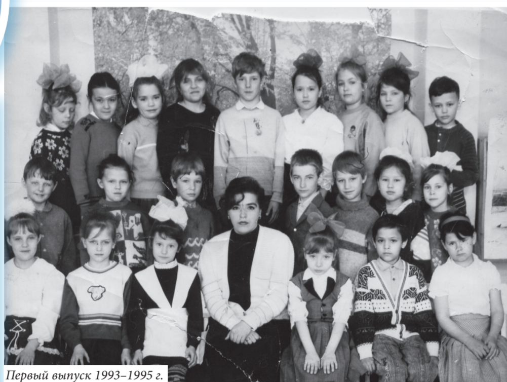
Первый выпуск 1993–1995 г.