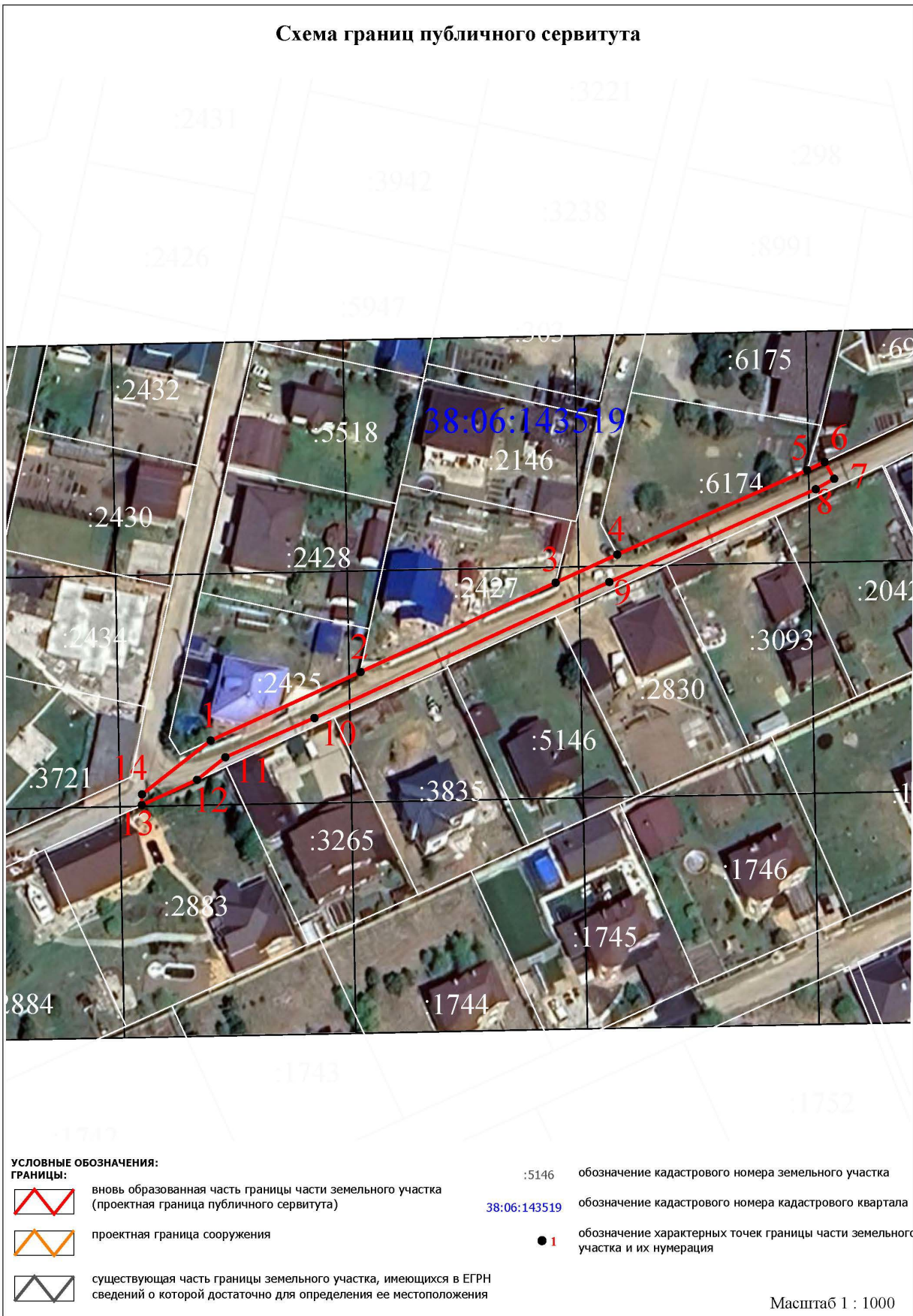
Схема границ публичного сервитута