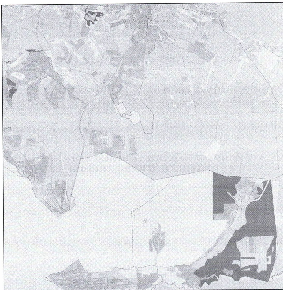
СХЕМА ГРАНИЦ, ИРКУТСКОГО РАЙОННОГО МУНИЦИПАЛЬНОГО ЛЕСНИЧЕСТВА

«Приложение 1 УТВЕРЖДЕНА постановлением администрации Иркутского районного муниципального образования от 01.09.2023 № 531