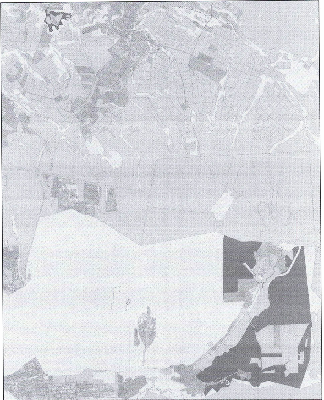
СХЕМА ГРАНИЦ ХОМУТОВСКОГО МУНИЦИПАЛЬНОГО УЧАСТКОВОГО ЛЕСНИЧЕСТВА, ИРКУТСКОГО РАЙОННОГО МУНИЦИПАЛЬНОГО ЛЕСНИЧЕСТВА