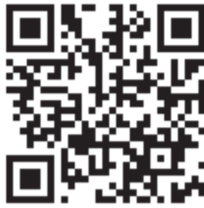
QR-код страницы Мэра района в сети «Телеграм»

Новый детсад мы возводим в рамках нацпроекта «Демография», завершить работы планируется до конца 2023 года. Общая стоимость строительных работ составит более 240 млн рублей из средств федерального, областного и местного бюджетов.