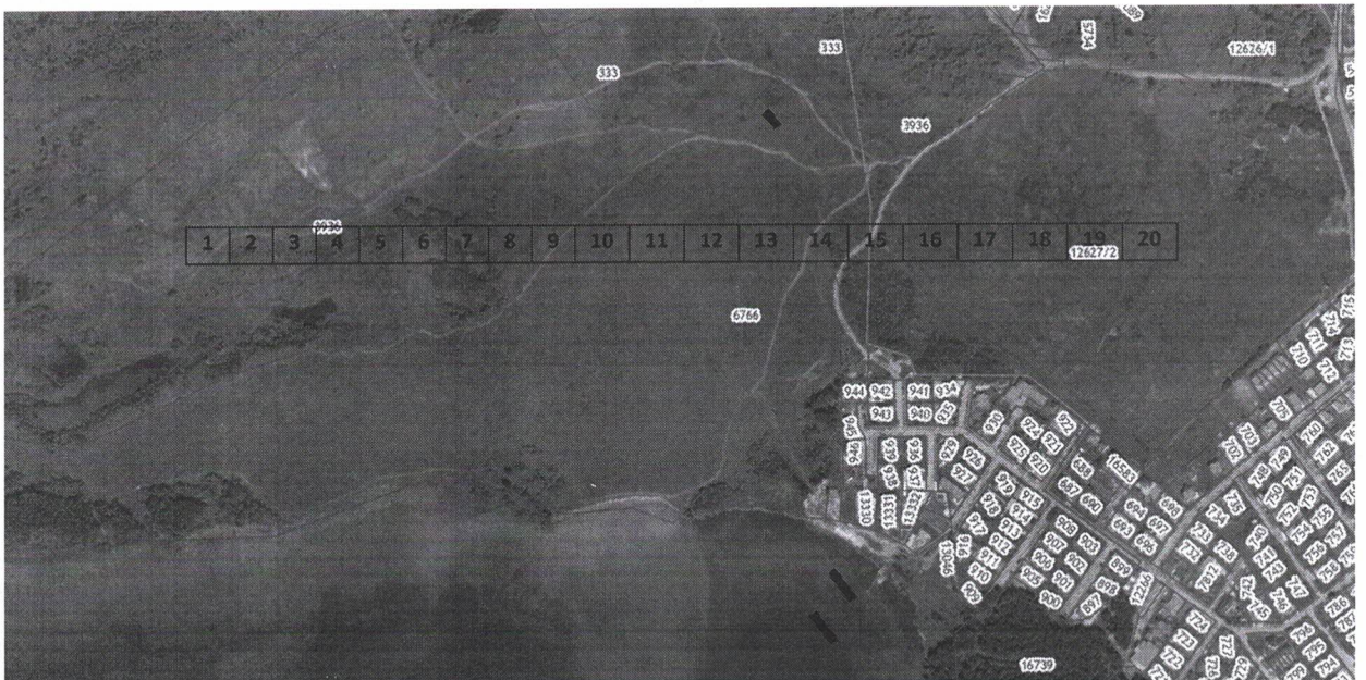
СХЕМА РАЗМЕЩЕНИЯ ТОРГОВЫХ МЕСТ НА ТЕМАТИЧЕСКОЙ ЯРМАРКЕ, «ШЕЛКОВЫЙ ПУТЬ»

Приложение 2 к Порядку организации тематической ярмарки «Шелковый Путь», утвержденному постановлением администрации Иркутского районного муниципального образования от «02» 07. 2025 № 496