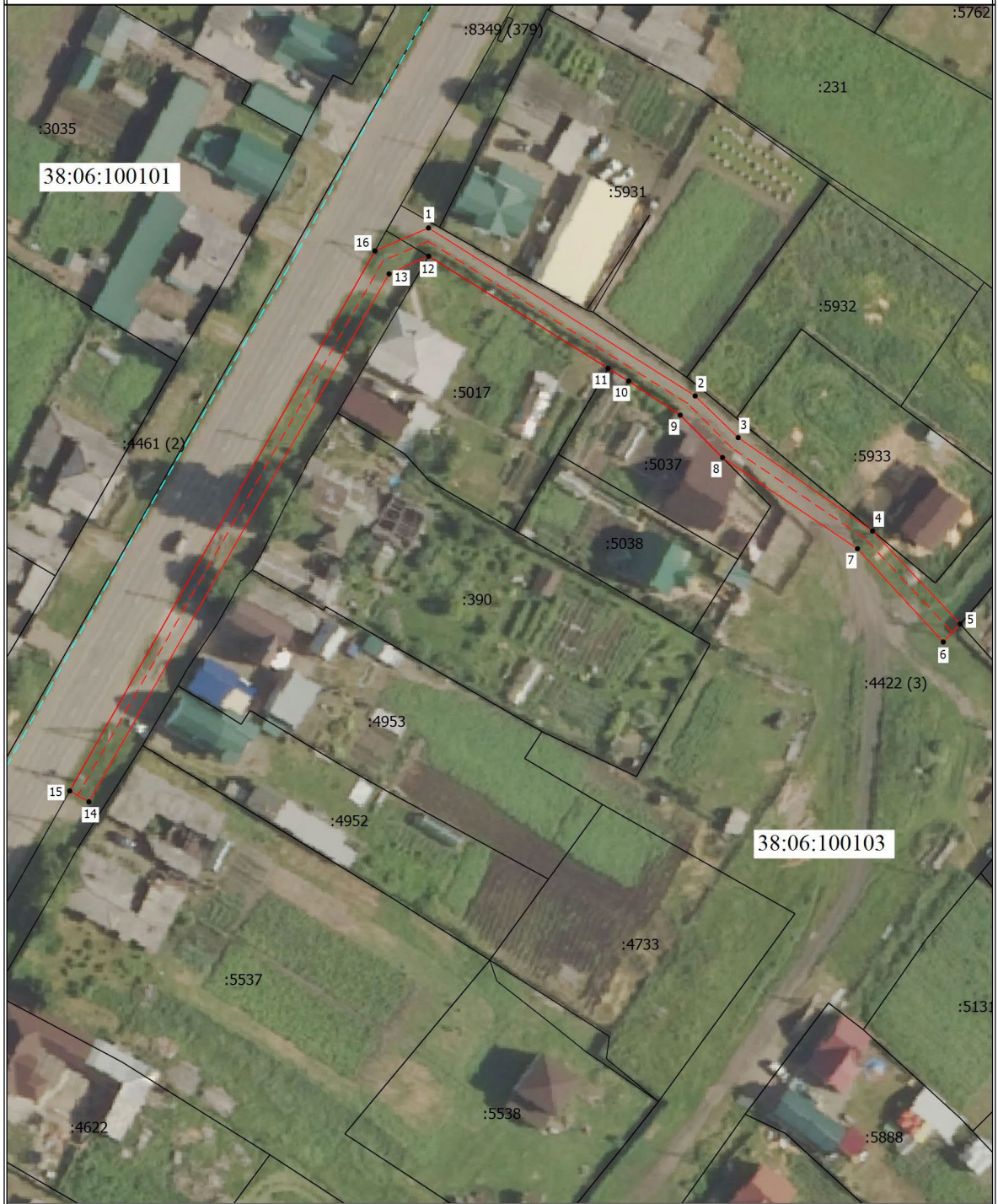
Схема границ публичного сервитута