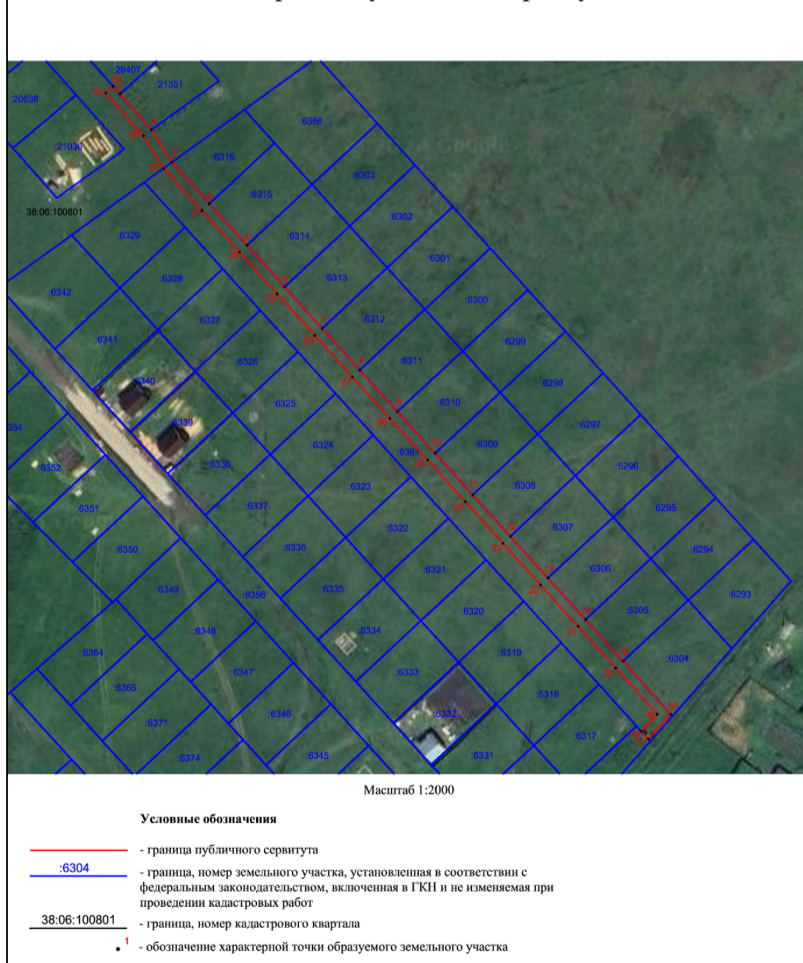
Схема границ публичного сервитута