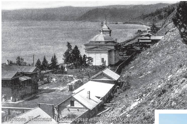
Церковь Николая Чудотворца в начале XX века

А вот тракт к припортовому селу появился только во второй половине XIX века. Пётр Кропоткин в 1865 году писал, что добраться до Кадильного мыса можно только через Листвянку, где была таможня, «собиравшая пошлину с чаёв и заморских товаров, вследствие чего последние совсем перестали привозиться в Иркутск».