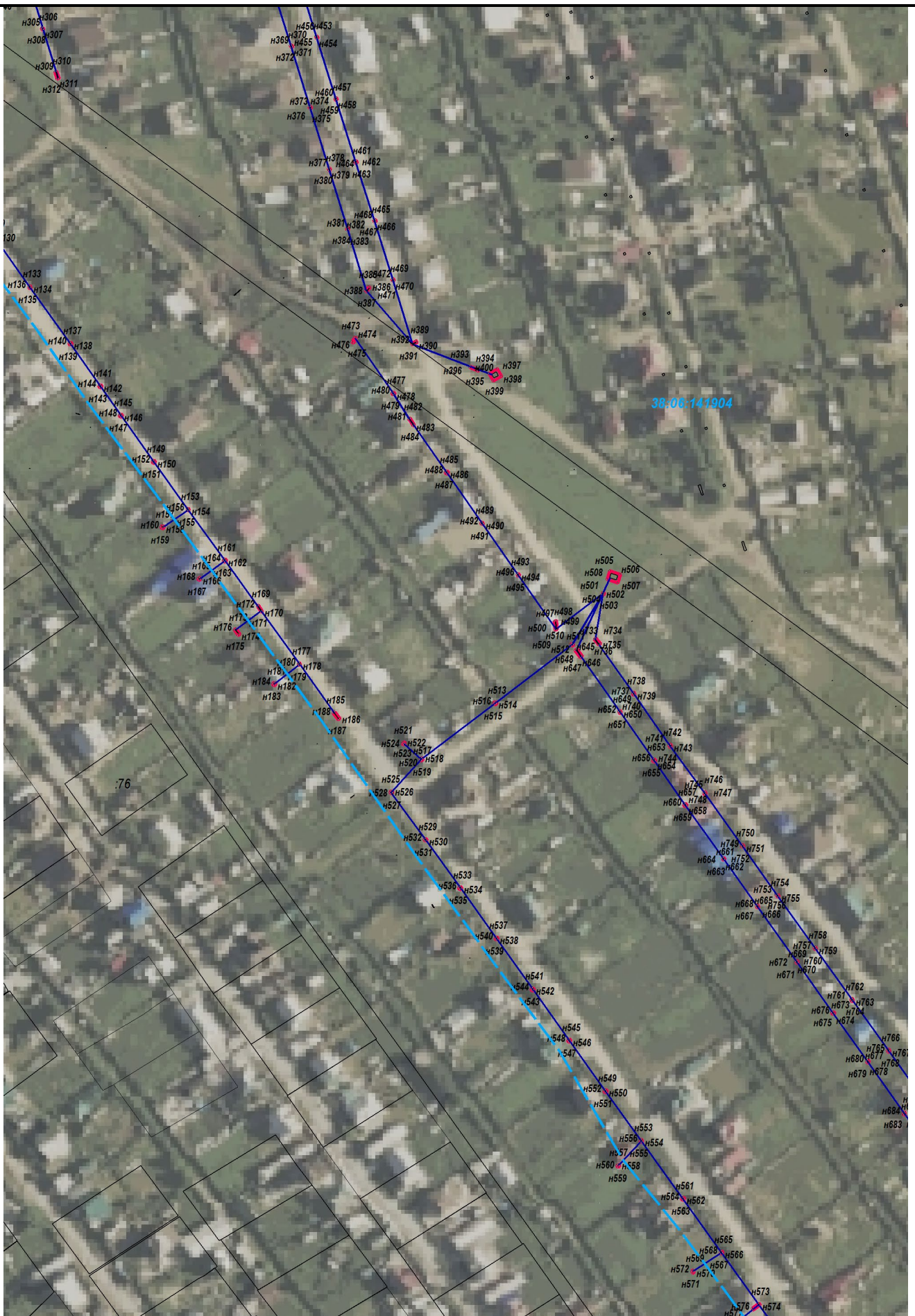
Масштаб 1: 2500