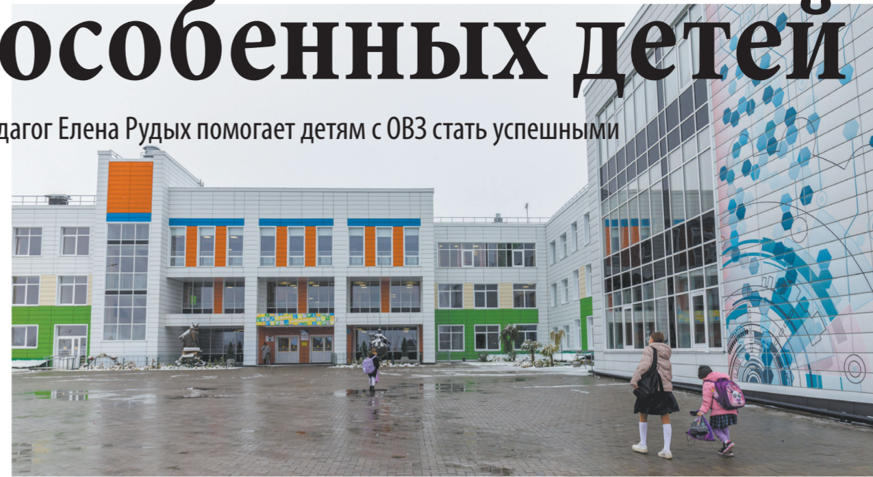
Хомутовская средняя школа № 1 является базовой опорной площадкой Института развития образования Иркутской области по профориентации. Цель работы – создать и внедрить модели профориентации, способные сформировать у ребят навыки к профессиональному самоопределению, в том числе в условиях инклюзивного образования

Например, если ребёнок с ОВЗ встанет с утра с плохим настроением, то его очень трудно включить в работу, никакие уговоры или даже