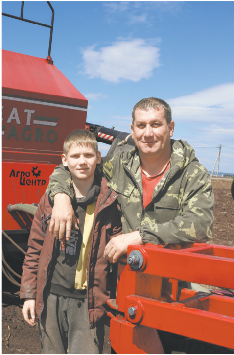
(начало на стр.1)

— От посева до первых всходов может пройти всего неделя, а может и больше, если поведёт с осадками, — объясняет мне руководитель хозяйства.