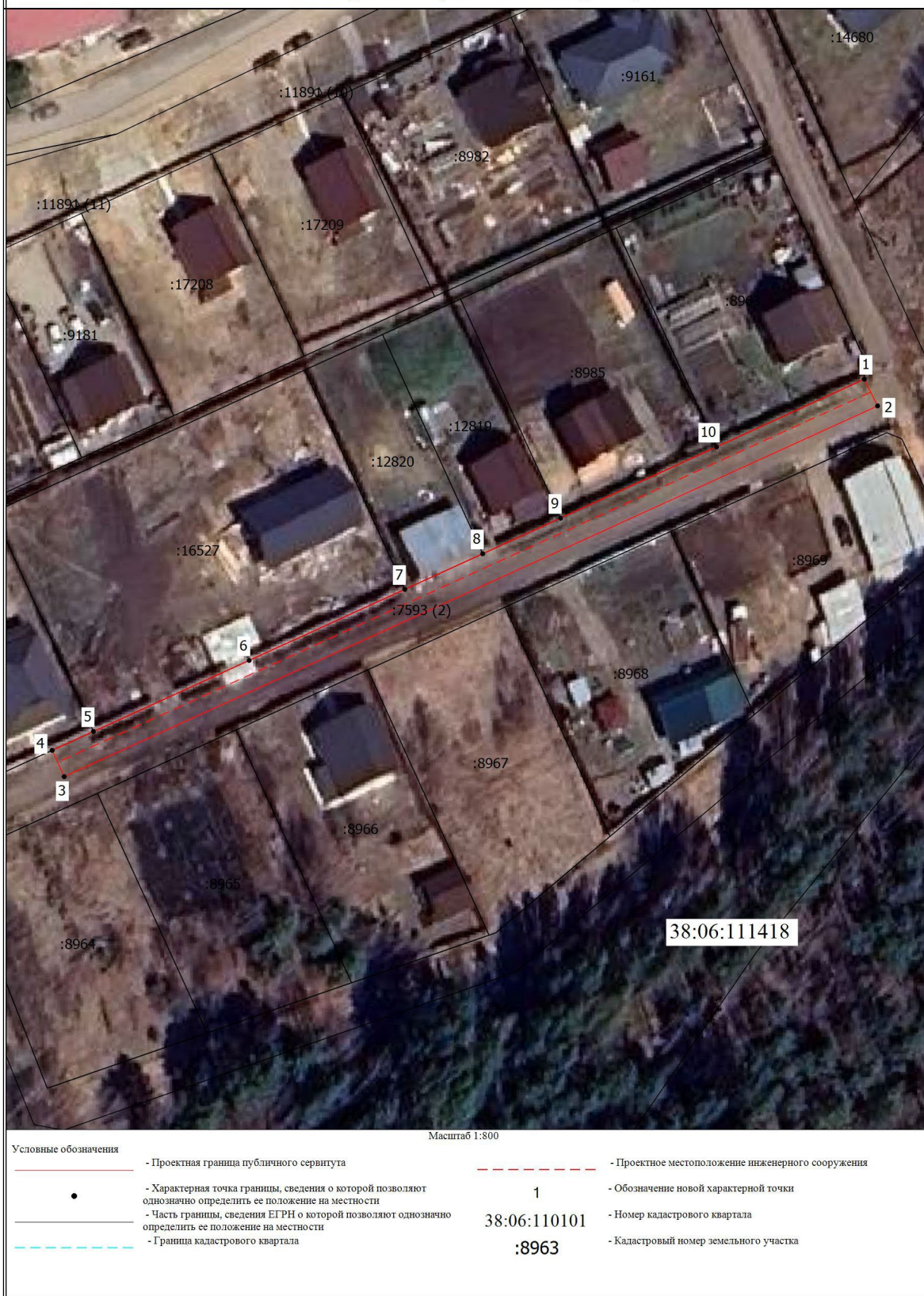
Схема границ публичного сервитута