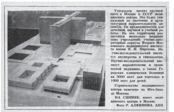
Утвержден проект крупнейшего в Москве и СССР медицинского центра. Это будет уникальной по значению и архитектурной выразительности ансамбль. Он предназначен для лечебной, научной и учебной работы. На его территории разместятся несколько медицинских учреждений: учебно-лабораторный корпус Второго Московского медицинского института имени Н. И. Пирогова, Научно-исследовательский институт акушерства и гинекологии, Научно-исследовательский институт паразитологии и тропической медицины, а также Городская клиническая больница на 3000 мест для взрослых и 1000 мест для детей. Строительство медицинского центра намечено на Юго-Западе Москвы. НА СНИМКЕ: манет медицинского центра в Москве.