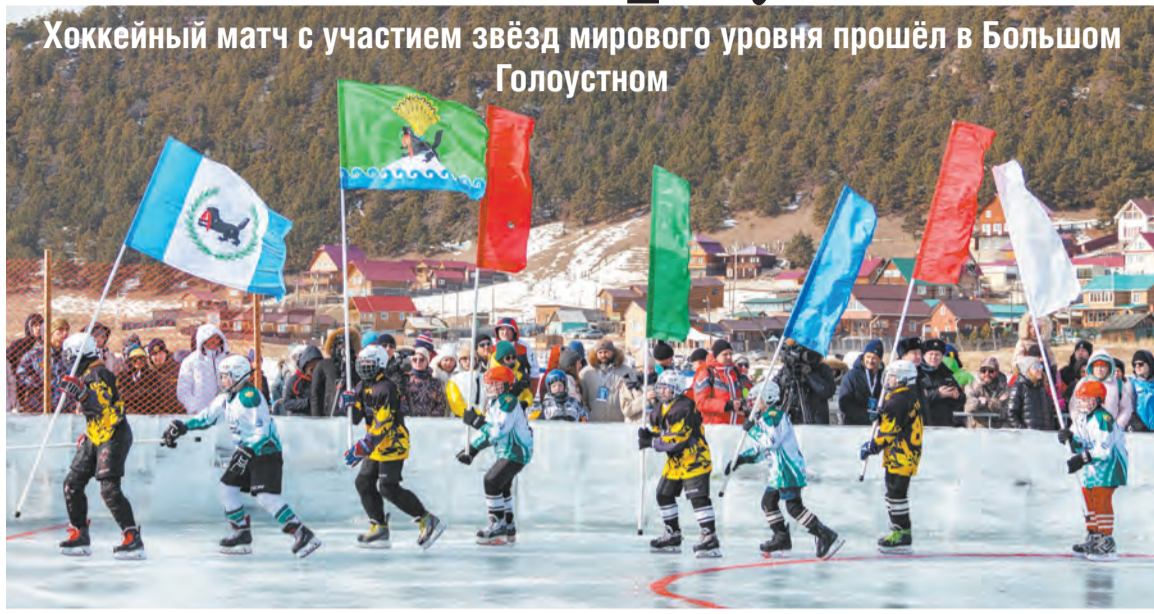
Хоккейный матч с участием звёзд мирового уровня прошёл в Большом Голоустном