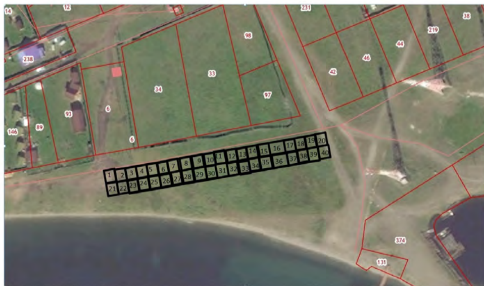
□ - Торговые места

Приложение 2 к порядку организации ярмарки «Ярмарка на льду», утвержденному постановлением администрации Иркутского районного муниципального образования от «22» 02 2023 г. № 109