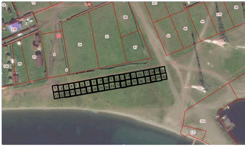
1 - Торговые места

Приложение 3 к Порядку организации универсальной праздничной ярмарки «Ярмарка на льду», утвержденному постановлением администрации Иркутского районного муниципального образования от «__» _____ 2024 г. № ____